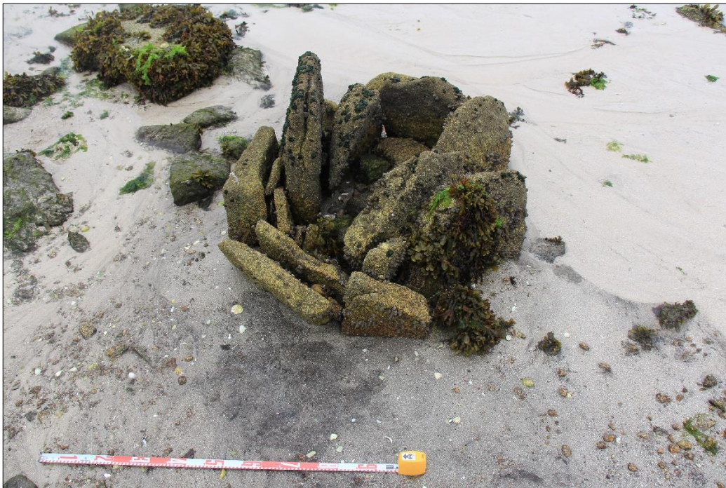
Figure 5 - Ciste de l'âge du Bronze sur l'estran de l'îlot de Guidoiro Areoso (Galice, Espagne). Septembre 2013 (cl. E. López-Romero).

Dans la péninsule ibérique, même si peu de projets de sauvegarde du patrimoine archéologique ont vu le jour, des programmes originaux attirent l'attention (López-Romero et al. , 2017); ainsi, l'îlot de Guidoiro Areoso, situé dans la Ria de Arousa au sein du parc national des îles atlantiques de Galice, a fait l'objet d'un programme de recherche et de sauvegarde des vestiges archéologiques néolithiques et protohistoriques, le Guidoiro Dixital , développé entre 2013 et 2015, suite au constat de l'altération et destruction de plusieurs monuments mégalithiques (López-Romero et al. , 2015) (fig. 5). D'autres cas d'érosion du patrimoine archéologique littoral en Espagne ont été également signalés, notamment sur la côte cantabrique (Alonso Rodríguez, 2019). Au Portugal, c'est principalement la vulnérabilité des sites de l'Algarve qui a été mise en évidence (Carrasco et al. , 2007). Sur le plan global, il est surprenant de constater que peu de sites en contexte submergé ou intertidal ont été signalés dans ce pays, tout du moins en ce qui concerne les occupations préhistoriques (Bicho et al. , 2020).