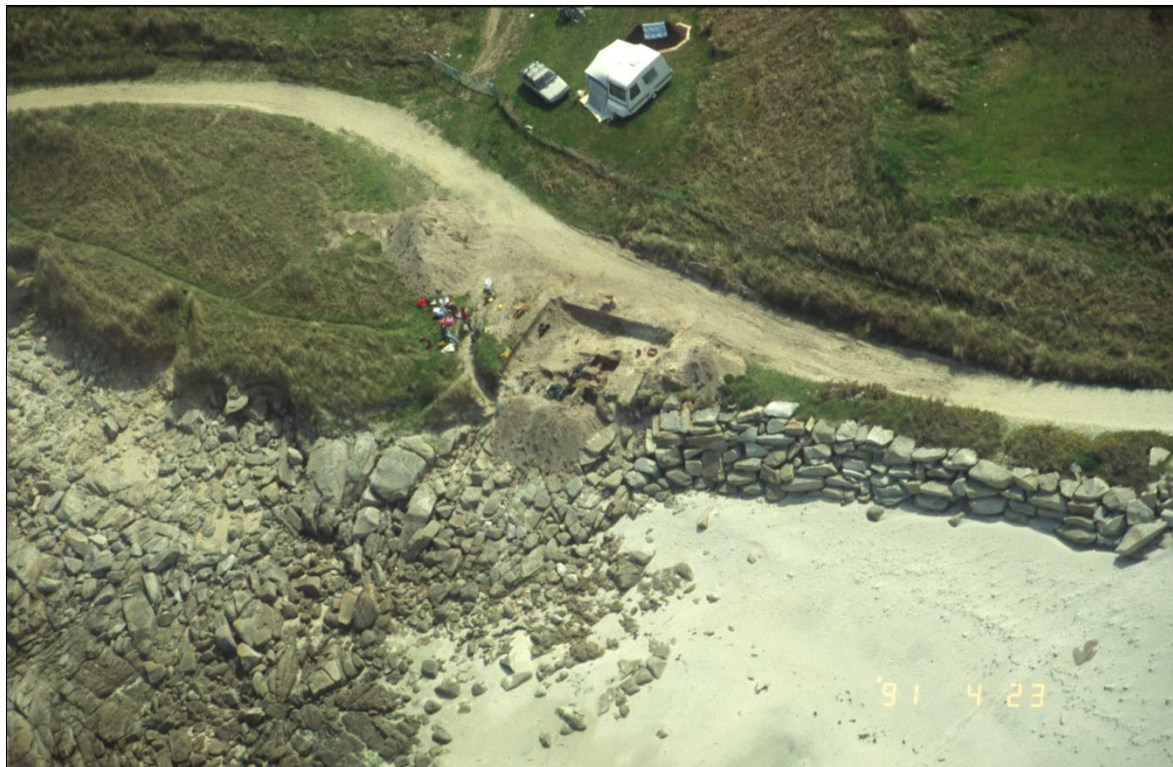
Figure 10 - Site protohistorique de Landrellec à Pleumeur-Bodou (Côtes-d'Armor, Bretagne, France), en cours de fouille programmée, du fait de l'érosion de la micro falaise dunaire accélérée malgré (ou à cause de) la présence de l'enrochement.

Ainsi, accepter ou ignorer la disparition-destruction des sites du patrimoine culturel rend compte de la valeur qui leur est attribuée (Loulanski, 2006). En cela, le patrimoine culturel n'a longtemps été qu'un instrument politique et économique et sa sauvegarde s'inscrivait alors pleinement dans une dynamique de profit unilatéral (Barthel-Bouchier, 2013 ; Tornatore, 2017). Aujourd'hui encore, la perspective marchande est bien visible à travers l'importance de moyens mis en place pour préserver certains sites à forte attractivité touristique face aux modestes mesures prises pour sauvegarder d'autres sites archéologiques parfois très vulnérables mais dont la valeur est essentiellement scientifique ou d'intérêt pour les communautés locales. Cependant, le patrimoine culturel est parfois considéré comme plus fragile et moins substituable que le patrimoine naturel, favorisant ainsi les dons d'argent pour sa protection (Fatoric et Seekamp, 2016, 2019). Ceci souligne bien le rapport des décideurs à la dualité nature/culture, paradigme qui peine à être dépassé (Maris, 2018) (fig. 10).