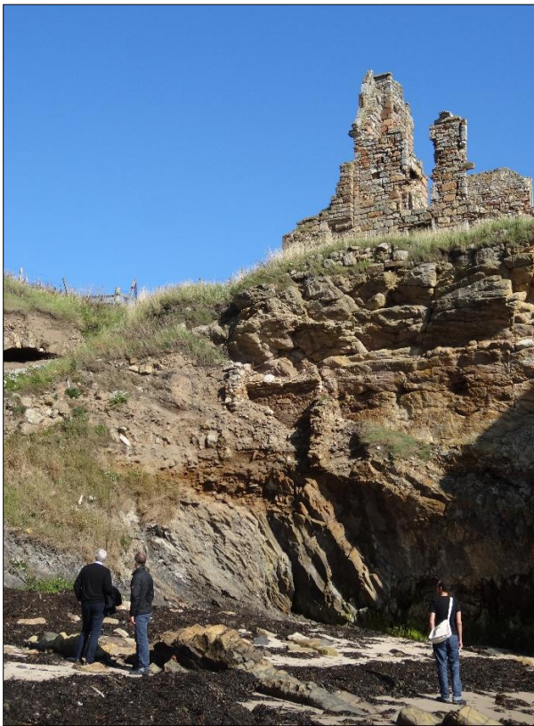
Figure 4 - Château de St Monans (Ecosse) en bord de falaise et partiellement détruit.

En Ecosse, le projet SCAPE, Scottish Coastal Archaeology and the Problem of Erosion , financé en grande partie par Historic Scotland et The Heritage Lottery fund , fait office de précurseur dans le développement de la démarche participative (Dawson, 2013, 2016 ; Dawson et al. , 2017), notamment à travers le programme Shorewatch à partir de 2004, mais surtout le projet SCHARP, Scotland's Coastal Heritage at Risk à partir de 2012 (fig. 4). Au Pays-de-Galles, The Arfordir Project s'est développé sur le même schéma entre 2005 et 2007 (Bowden, 2013).