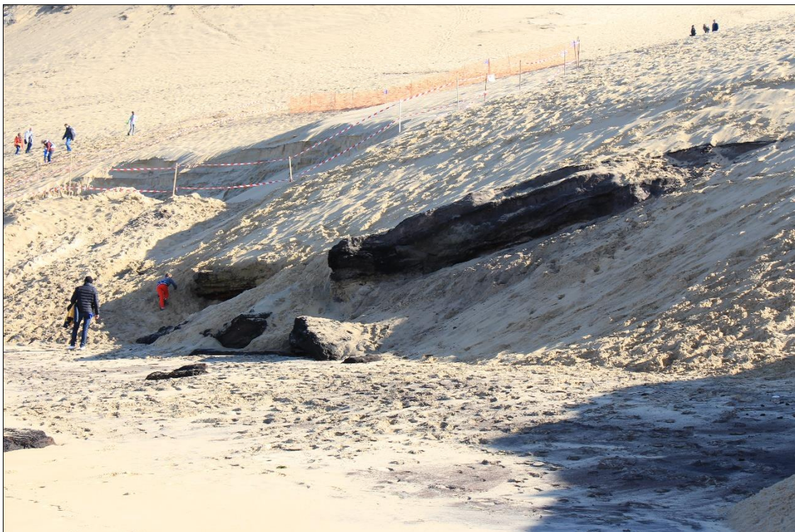
Figure 8 - Dune du Pilat (La Teste-de-Buch, Gironde). Paléosols affleurant sous la dune. Octobre 2018 (cl. E. López-Romero).

Sur la côte aquitaine, les problématiques traitées par le projet ALeRT trouvent des échos dans d'autres programmes ; le projet LITAQ : « Du pléistocène à l'Anthropocène, connaître les mécanismes passés d'évolution des populations (végétales, animales, humaines) et des milieux pour prédire les réponses futures : l'exemple du littoral aquitain, sur la façade littorale de l'Aquitaine » 11 enregistre le patrimoine archéologique côtier, grandement soumis aux vulnérabilités d'un milieu côtier très fragile et soumis à des pressions constantes (affluence touristique, sédimentation sableuse) (fig. 8) ; cette démarche se prolonge dans le cadre du projet ESTRAN 12 (Erosion et Sociétés dans le Temps long sur les Rivages de l'Aquitaine Nouvelle) (Verdin, 2021). Ce projet collaboratif ne met toutefois pas en exergue des outils spécifiques d'évaluation de la vulnérabilité des vestiges archéologiques mais vise davantage à comprendre les dynamiques de peuplement et des littoraux ainsi que les relations homme-environnement dans un contexte érosif accéléré (Bertrand et al. , 2019).