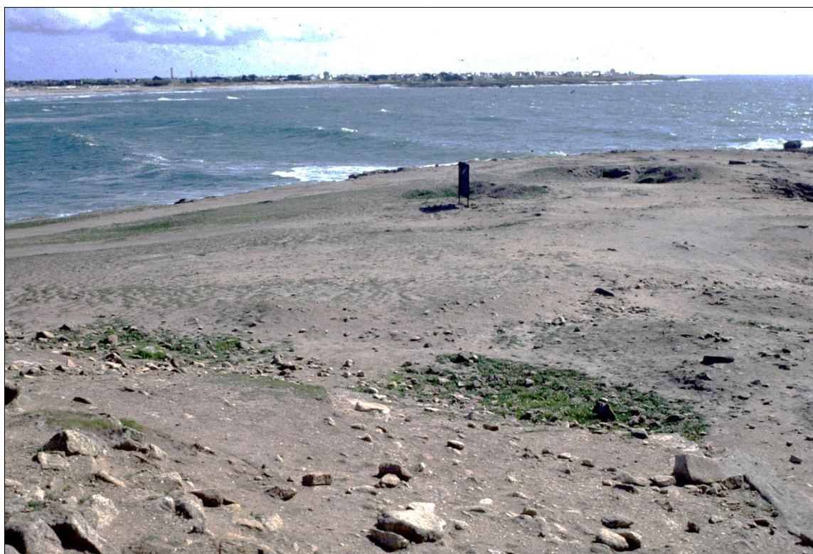
Figure 7 - Site préhistorique et protohistorique de la Torche à St-Gwenolé-Penmarc'h (Finistère, Bretagne, France) subissant l'érosion des sols par le ruissellement.