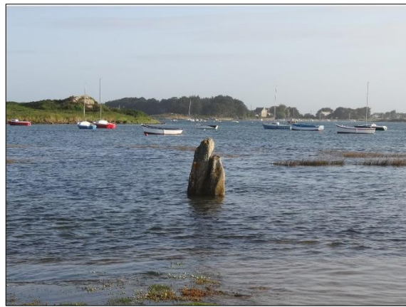
Figure 2 - Le menhir préhistorique de Toëno à Trébeurden (Côtes-d'Armor, Bretagne, France), au rythme des marées.