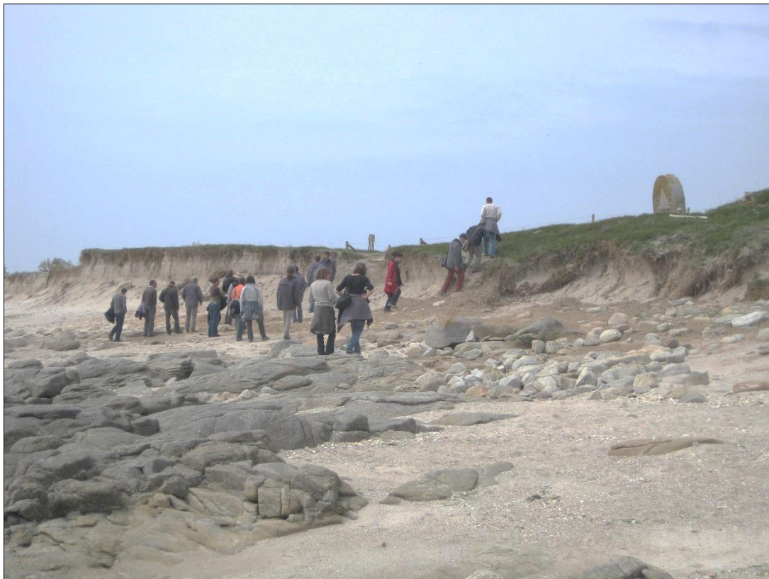
Figure 9 - Formation de terrain des gardes du littoral sur un site de l'île d'Hoedic (Morbihan, Bretagne, France) en cours d'érosion.

Le niveau d'intégration des populations locales peut faire varier la méthodologie des projets ; si plusieurs d'entre eux intègrent le grand public dans une démarche citoyenne ( Nuvuk Archaeology Project , ALOA ...), d'autres sollicitent davantage des publics ciblés tels les écoliers et lycéens, les rangers autochtones ou les tribus amérindiennes. À titre d'exemple, si le projet ALeRT sollicite le grand public, une action de sensibilisation spécifique a été menée en direction des gardes du littoral en charge de la surveillance et de la gestion au quotidien d'espaces affectés par le Conservatoire du Littoral (Dutouquet et Daire, 2010) (fig. 9).