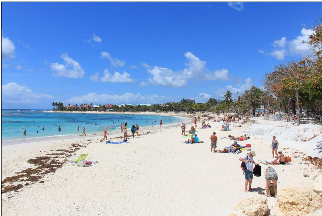
Figure 11 - Cimetière colonial de la plage des Raisins Clairs (Guadeloupe, Antilles). À droite de l'image, le géotextile qui protège les tombes en cours d'érosion est visible. Mars 2018.

Outre les moyens disponibles, le contexte socio-culturel apparaît comme un facteur conditionnant fortement les méthodologies mises en œuvre ; la conception du territoire, de la terre habitée influe sur les démarches entreprises (Berque, 2010). L'étude et la sauvegarde des sites funéraires et des cimetières, quelle que soit leur datation, constituent très fréquemment un sujet sensible au-delà de la seule vulnérabilité des vestiges, ainsi que cela se vérifie dans le cas des cimetières littoraux d'époques précolombienne ou coloniale aux Antilles (Bonnissent et al. , 2018) (fig. 11). En Californie, la destruction des sépultures par des événements climatiques violents n'apparaît pas, pour certaines tribus, comme un fait marquant de la disparition d'un patrimoine culturel et les agences fédérales ne peuvent pas agir pour le rapatriement de ce type de vestiges (Braje, 2010). La question de l'acceptabilité par les populations locales est donc au cœur des réflexions méthodologiques et constitue un sujet d'autant plus sensible dans des territoires au passé colonial ou encore dans les zones ayant fait l'objet de pillages.