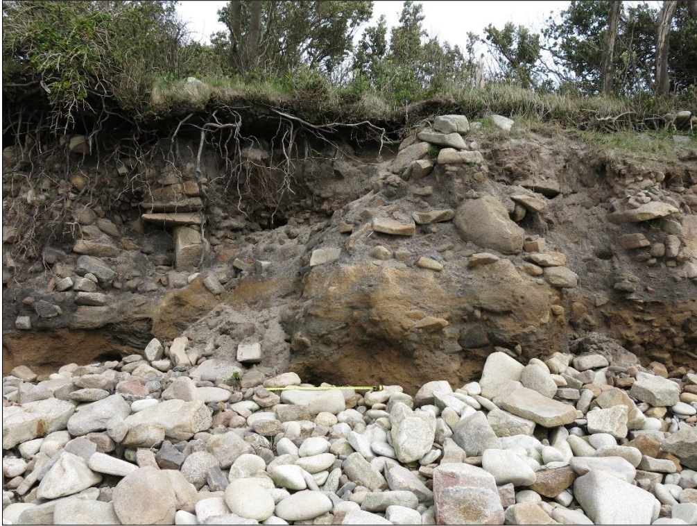
Figure 3 - Habitat préhistorique de Porth Hallangy Down (Saint Mary's, îles Scilly, Angleterre). Falaise avec structures en cours d'érosion. Avril 2015.