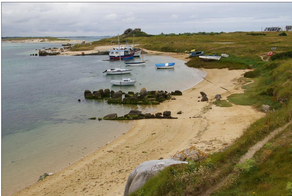
Figure 6 - Allée couverte néolithique du Kernic à Plouescat (Finistère, Bretagne, France).