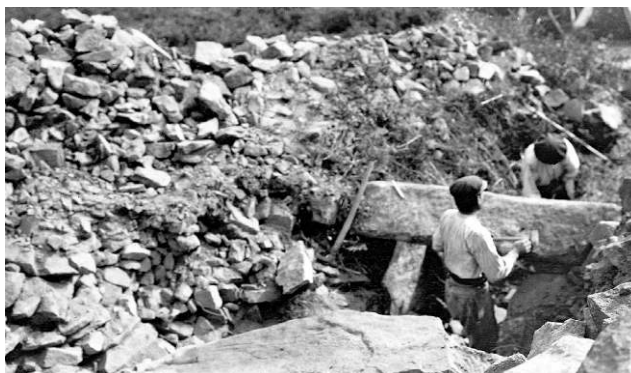
Figure 9 : Fouille du monument mégalithique de l'île Longue (Baden, Morbihan) (cliché G. d'Ault du Mesnil, 26 septembre 1907, archives du Laboratoire Archéosciences-CReAAH).

C'est dans l'immédiat après-guerre que sera créé le « Laboratoire d'Anthropologie » de la faculté des sciences, dénommé ensuite « Laboratoire d'Anthropolo-