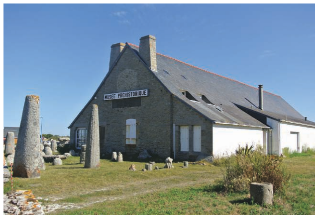
Figure 7 : Le musée préhistorique finistérien de Penmarc'h (cliché M.-Y. Daire, septembre 2012).

La période 1850-1939 est marquée par un contexte international où la Préhistoire européenne trouve ses fondements en tant que discipline scientifique à part entière et par un cadre national où, on l'a vu, la vie scientifique tourne autour