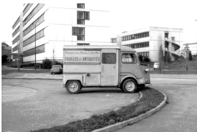
Figure 11 : Le camion des « Fouilles et Antiquités » sur le campus de Beaulieu à Rennes, vers 1960.

Milon (1897-1987) 6 ou Léon Collin (1872-1945), firent don d'une partie de leurs archives. Elles sont aujourd'hui encore conservées au Laboratoire Archéosciences. Le laboratoire connut un déménagement dans les années 1960, depuis les anciens locaux de l'Institut de géologie dans le centre de Rennes vers le campus scientifique de Beaulieu (fig. 11), ce qui préserva l'intégrité de ce fonds documentaire, qui constitue une source d'information de premier ordre pour la compréhension du développement de la Préhistoire et de l'archéologie en Bretagne et un riche potentiel scientifique (López-Romero, Daire, 2013 ; Daire, López-Romero, 2014).