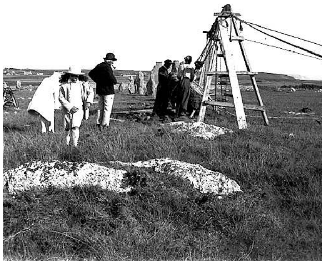
Figure 10 : Restauration des alignements de stèles de Lagatjar à Camaret (Finistère) en 1928-1929.

Figure 9: Excavation of the megalithic monument on Île Longue (Baden, Morbihan).