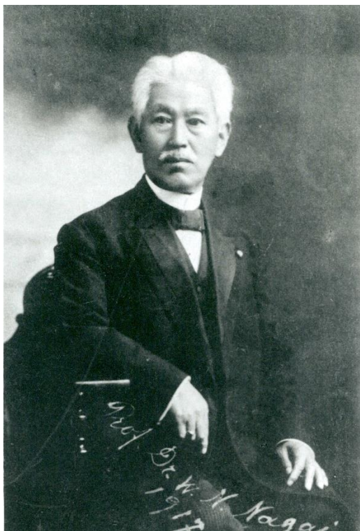
Figure 3 : Professeur Nagai Nagayoshi, pharmacologue (1845-1929)

En 1919, suite aux travaux d'Akira Ogata, la forme chlorhydrate cristallisée de la méthamphétamine apparaît, obtenue par réduction de l'éphédrine à l'aide de phosphore rouge et d'iode (21). Dès 1920, la méthamphétamine est brevetée (22).