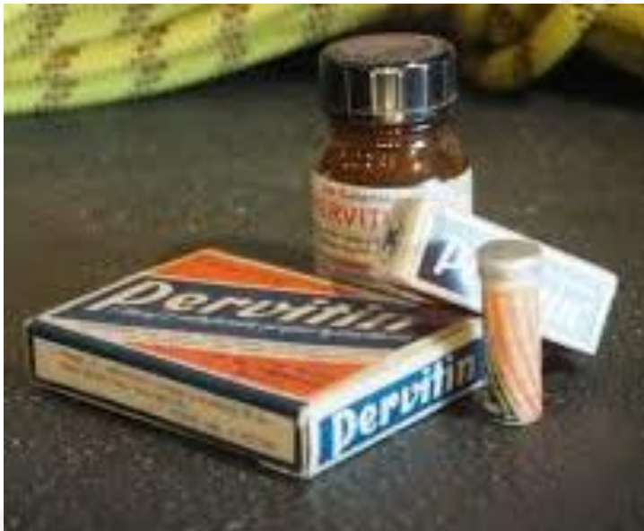
Figure 4 : Première spécialité pharmaceutique contenant de la méthamphétamine : la Pervitin ®

En France, la méthamphétamine, commercialisée sous les noms Tonedron ® et Maxiton ® , a principalement été utilisée par les étudiants en période d'examen et se fait connaître aux yeux du public par l'intermédiaire du dopage sportif en 1967. Cette année-là, Tom Simpson, coureur cycliste anglais, perd la vie sur les pentes du mont Ventoux lors du tour de France. Plusieurs tubes de Tonedron ® sont retrouvés dans son maillot (32). A posteriori , le rugbyman Amédée Domenech avoua également avoir consommé du Maxiton ® à l'occasion de la rencontre France – Afrique du Sud en 1961 (33).