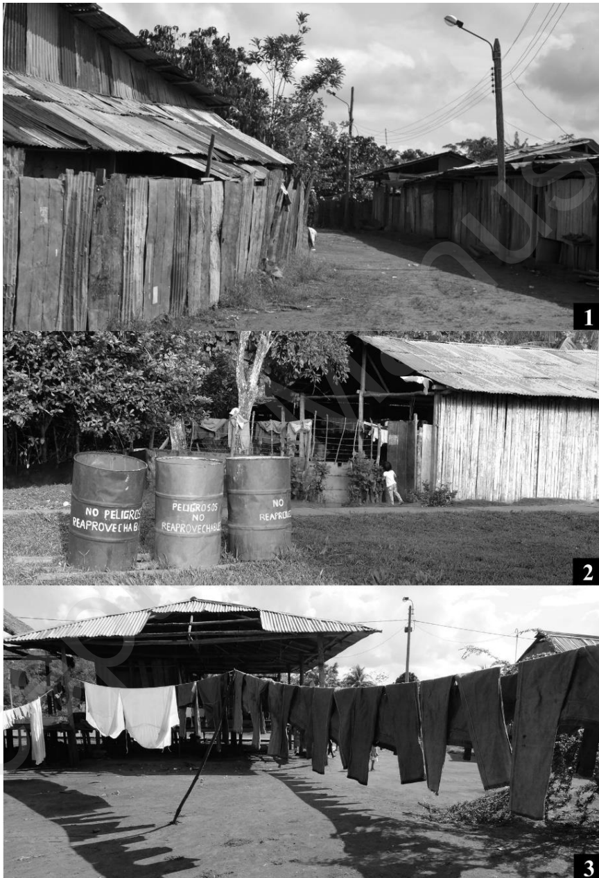
Figure 3 : Artefacts industriels dans les villages

S'observe également une tendance à la normalisation des espaces communs. « Nous allons arranger ce chemin, pour qu'il soit droit au lieu de zigzaguer », m'annonce un jour Mauricio, le président de l'entreprise de Capahuari, désignant le chemin de terre qui débouche sur le sentier emprunté pour accéder à la route : il souhaite « faire venir les machines pour urbaniser le village 33 ». Peu à peu, les