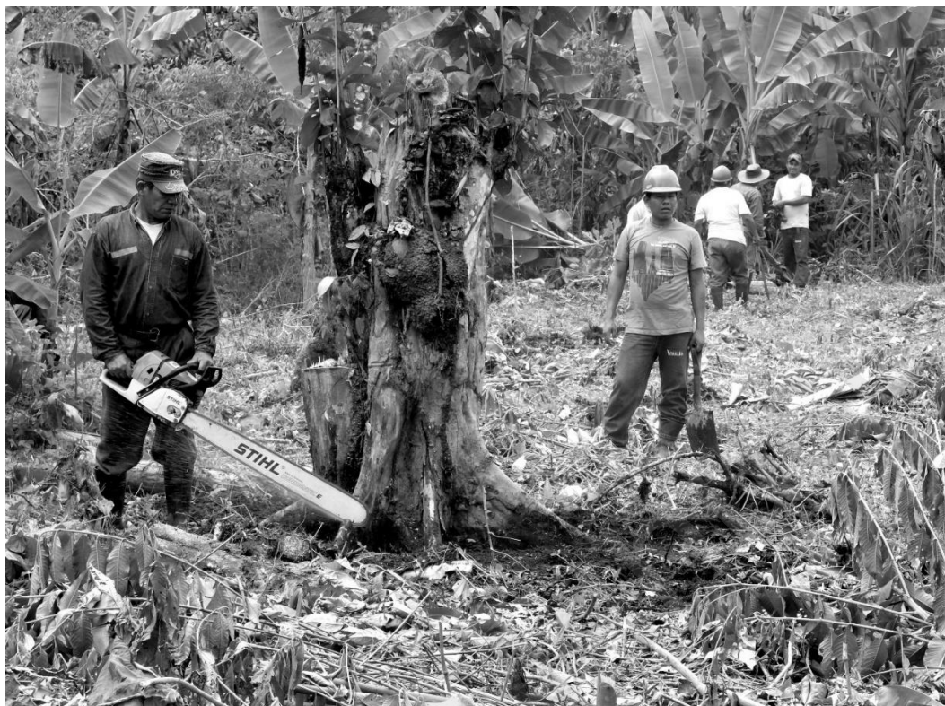
Figure 4 : Contremaître et ouvrier-tronçonneur au travail pour la communauté

Est aussi repris le principe de division du travail et de hiérarchisation des rôles : les compétences certifiées par Pluspetrol sont réinvesties dans l'organisation du travail communal ; les femmes endossent la fonction de « cuisinières » pour assurer la « pension » des habitants, délaissant le défrichage qui est traditionnellement une activité mixte 38 . L'espace lui-même est pensé selon des fonctions spécifiques. Le travail communal consiste à édifier une auberge dédiée aux élèves : il s'agit de les concentrer en un seul lieu où s'appliqueront des règles spécifiques, à distance des lieux de diversion du village. Les villageois manifestent ainsi leur souci de contrôler l'activité des collégiens pour qu'ils se concentrent sur leurs études 39 .