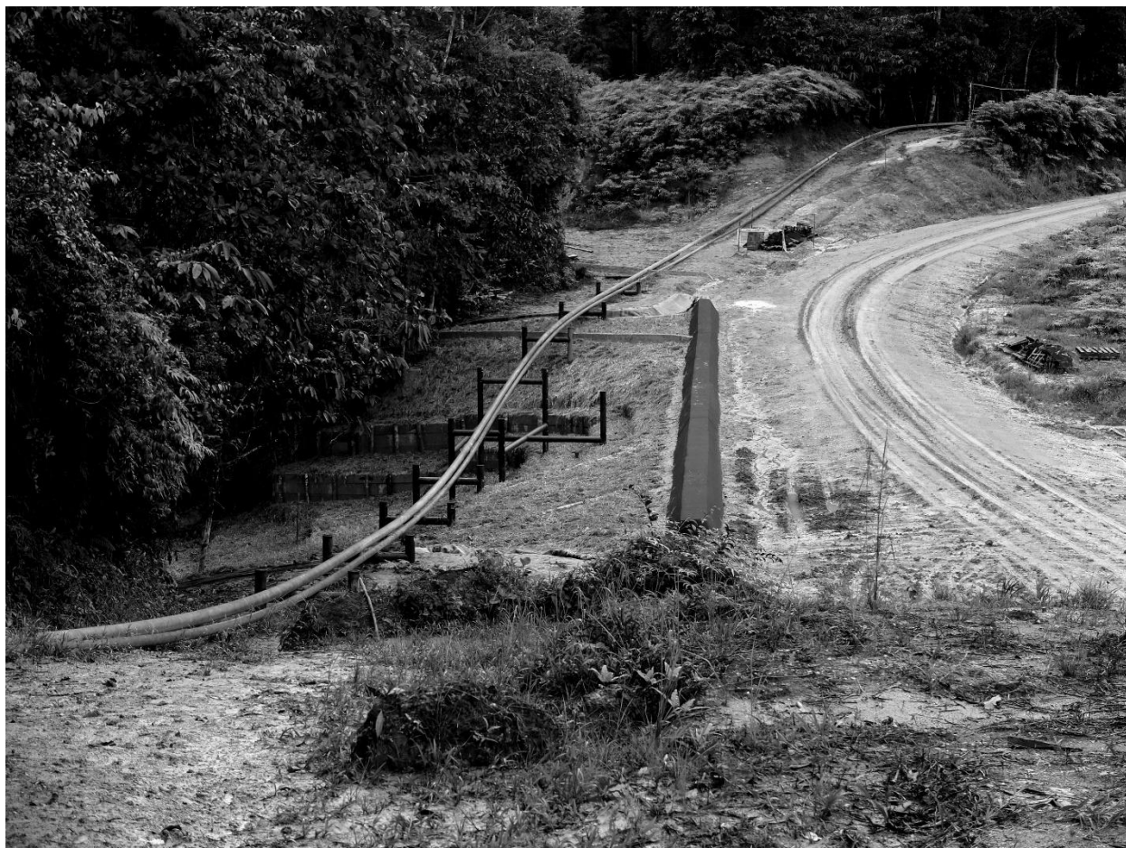
Figure 1 : Protéger l'infrastructure industrielle de l'environnement naturel

La réalisation de ces travaux n'est pas anodine : sans eux, de nombreux dysfonctionnements entraveraient la production. Surtout, cette activité n'a rien d'évident pour les habitants-ouvriers. Ces espaces sont parcourus pour les besoins de la chasse, de la cueillette ou de la pêche, par le passé mais aussi aujourd'hui, bien que dans une moindre mesure. Ce type d'usage n'implique pas une transformation majeure de l'environnement : un léger débroussaillage à la machette suffit à l'entretien d'un réseau de petits chemins imperceptibles aux yeux des citadins. Ce qui ne veut pas dire que la nature « sauvage » s'imposerait à ses habitants et déterminerait leurs pratiques. À l'encontre du déterminisme écologique, l'anthropologie de la nature initiée par Philippe Descola souligne l'existence de « modes de socialisation de la nature » spécifiques qui permettent d'établir une continuité entre l'espace domestique et l'espace naturel (Descola 2005). La maintenance des infrastructures suppose un autre type de socialisation de la nature. Le terrain argileux et le climat tropical sont peu propices à l'activité industrielle. En permanence, il faut abattre les arbres et élaguer régulièrement la végétation ; lutter contre l'érosion des sols, elle-même favorisée par l'abattage des arbres ; contrôler la corrosion des tubes métalliques, soumis à l'humidité constante. Le rapport n'est plus de continuité mais de rupture : l'industrie doit l'emporter sur la nature.