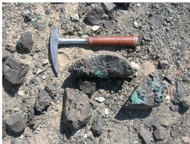
Figure 4 : Fragments de scories épandues sur le sol