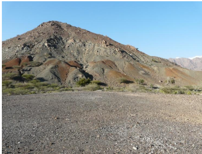
Figure 2 : Exploitations minières de surface par grattage du flan de colline. Les déblais sont visibles sous forme de monticules bruns et gris.

ayant chevauché la croûte terrestre présente des enrichissements en cuivre, d'autant plus que le cuivre a été remobilisé au moment de la création de cette ophiolite par d'autres circulations de fluides, dans des fractures notamment, conduisant à la formation de filons minéralisés. Ces filons sont composés de sulfures en partie profonde. En s'approchant de la surface, les sulfures s'altèrent et d'autres minéraux cristallisent, en accord avec les conditions oxydantes de surface. Ce sont des sulfates de cuivre, mais aussi et surtout des oxydes et des carbonates de cuivre. Au niveau de la surface, la zone d'altération est telle qu'il se forme ce que l'on appelle un chapeau de fer, concentrant divers métaux mais plus particulièrement du fer, donnant au sol une couleur rouille à l'emplacement de ces filons de cuivre. La chaîne de montagnes al-Hajjar correspond donc à une région riche en cuivre, particulièrement dans sa partie centrale localisée sur l'Oman. Néanmoins, la partie nord de la chaîne, notamment dans l'émirat de Fujairah, recèle également des filons qui ont pu être exploités aux périodes anciennes.