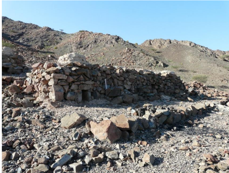
Figure 3 : Reconstitution de fours de réduction des minerais de cuivre

Un projet de recherche a été initié suite à la découverte d'un atelier de métallurgie dans la vallée de Bithnah (Emirat de Fujārah) grâce aux scories. D'autres ont été trouvées également sous forme de dépôts dans des bâtiments, probablement à vocation culturelle. Mais le programme de recherche sur la production du cuivre a véritablement été engagé lors de la fouille du site de Masafi (Emirat de Fujārah, Dir. Anne Benoist), qui a conduit à la découverte de deux jarres enterrées et remplies de lingots et de fonds de fours de cuivre, au nombre de 265 dans un bâtiment collectif. Ce projet de recherche s'intéresse à la métallurgie de cuivre à l'âge du Fer (1250-300 BC), à la technologie employée, et à l'organisation générale de cette production au sein des sociétés. En d'autres termes, il s'agit de repérer et d'identifier les sites de production (mines et ateliers de réduction) et les sites de fabrication des objets manufacturés, et de déterminer les techniques de réduction du minerai. Il s'agit également d'identifier la signature chimique du métal tout au long de la chaîne opératoire, depuis le minerai jusqu'aux objets finis, et de son changement en lien avec les traitements subis au cours des diverses opérations. Enfin, le programme s'intéresse aussi à l'usage de ce métal, à savoir s'il était destiné à un usage local ou si la production était suffisante pour permettre un commerce à grande distance.