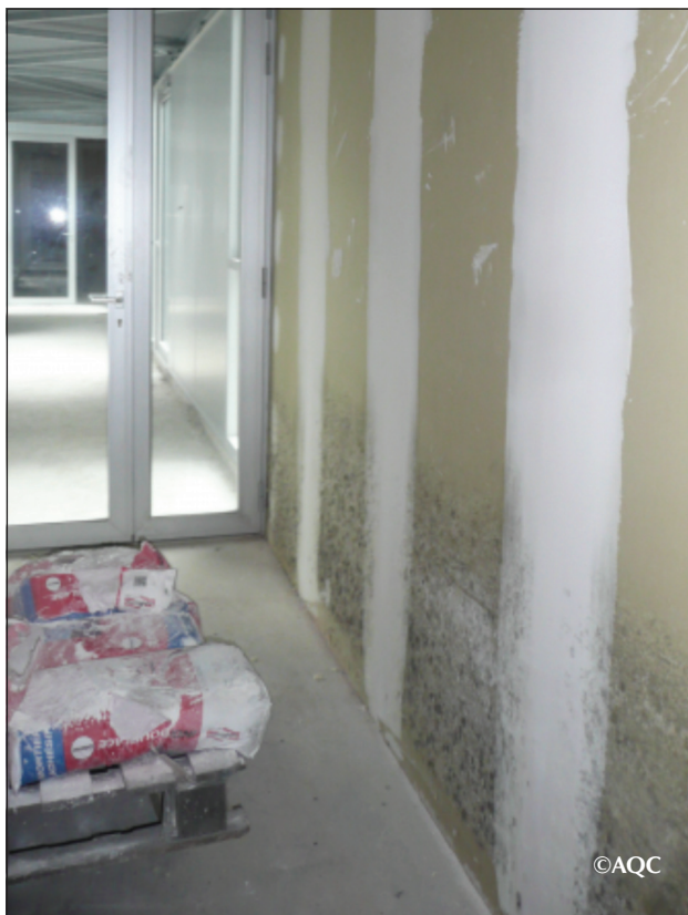
Figure 1. Développement de moisissures sur des plaques de plâtre en phase chantier.