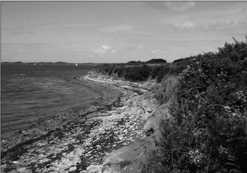
Figure 6 : Partie du four encore conservée en falaise du site d'Ilur Sud, sur la commune de l'Île d'Arz en 2011.

Cette fouille a permis, cette fois encore, de sauver des informations scientifiques et patrimoniales, puisque la coupe de falaise est continuellement agressée par l'érosion naturelle (marine et éolienne). Sans cela, nous n'aurions sans doute pas eu connaissance de ce mode de conservation de la saumure, qui était inédite. Une partie du four est actuellement encore conservée dans la coupe de falaise, qui a cependant continué à reculer depuis l'intervention archéologique (Fig. 6).