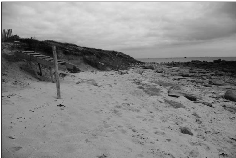
Figure 9 : Le site de Sterflant à Hoedic après les tempêtes de l'hiver 2013-2014.

La position du site au sein d'un massif dunaire très épais, dans un terrain protégé appartenant au Conservatoire du Littoral, fait qu'il ne sera pas fouillé, tant pour des questions techniques qu'au regard de l'objectif de protection du secteur, une intervention avec des moyens mécaniques étant inenvisageable. Ces opérations rapides et régulières de suivi archéologique offrent donc une solution pour pallier la disparition de ces données.