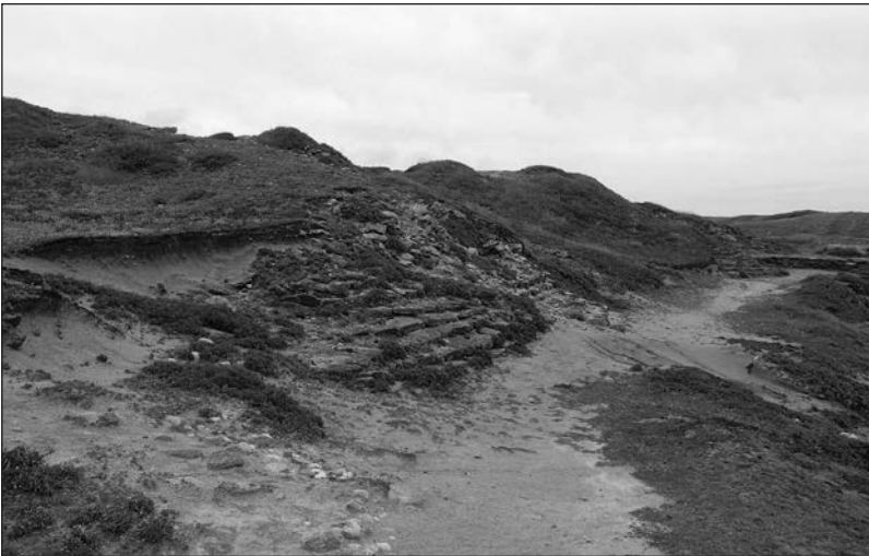
Figure 7 : Les trois types de facteurs d'érosion présentés sur le site de Beg-en-Aud. À gauche, l'érosion d'origine éolienne, au centre l'érosion anthropique par piétinement, à droite l'érosion pluviale par ruissellement.

Les vents et les embruns érodent de manière constante la partie sud-ouest du site, et ces dégradations sont aggravées durant les périodes hivernales. Plusieurs facteurs d'érosion affectent ainsi le site : d'une part des causes naturelles, éolienne et pluviale, et d'autre part, des facteurs anthropiques avec le chemin piétonnier (Fig. 7).