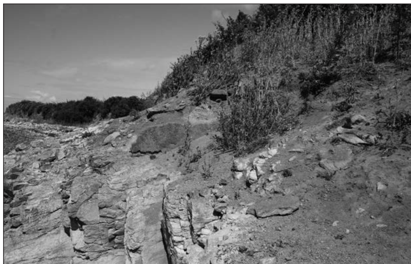
Figure 5 : Site d'Ilur Sud à l'Île d'Arz en 2011 (cliché M.-Y. Daire).

cours des années 1990. Ce site d'atelier de production de sel gaulois de La Tène finale (II/I av. J.-C.), aujourd'hui en falaise, subissait une érosion du sol et des niveaux archéologiques, du fait de plusieurs facteurs : la pente naturelle du terrain (orientée sud-ouest), l'exposition de la falaise meuble aux intempéries, et un couvert végétal insuffisant pour stabiliser le sol (avec des colluvionnements des sols vers la falaise) ; (Fig. 5). Cette situation a motivé la réalisation d'un sondage en 1992 qui a permis, dans un premier temps, d'évaluer l'état de conservation de l'ensemble ainsi que de vérifier la nature des structures existantes. Les résultats ainsi obtenus et la situation en falaise du site ont favorisé la mise en place une fouille de sauvetage en 1993.