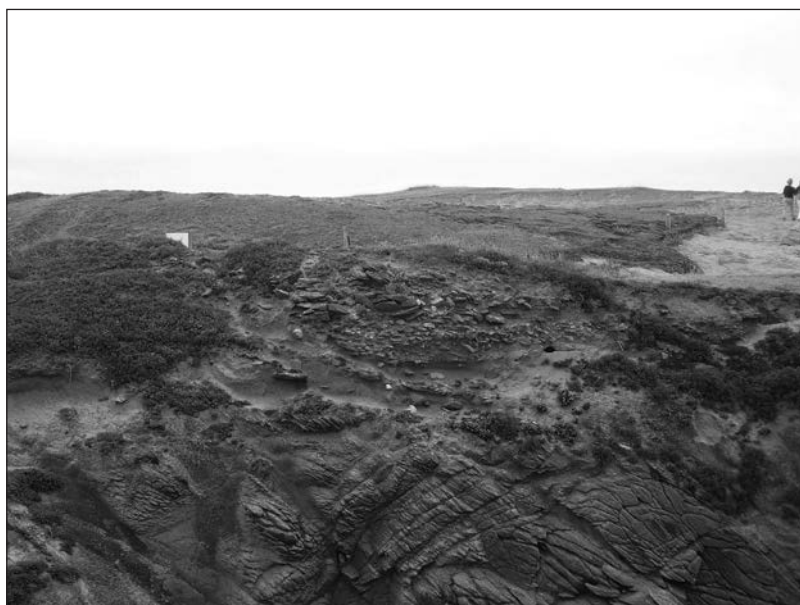
Figure 8 : Structure en falaise sur le site de Beg-en-Aud.

Malgré la mise en place de structures de protection par le Conservatoire du Littoral (propriétaire du terrain ; chemins piétonniers par exemple), le site se dégrade inexorablement. L'apparition de structures (Fig. 8), de strates archéologiques et de mobilier en falaise permet de constater dans un premier temps la disparition d'une partie du site, et dans un second temps de mettre en avant cette érosion qu'il est ici quasiment impossible de stopper.