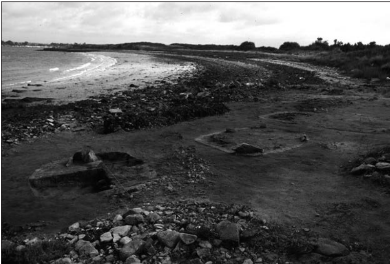
Figure 3 : Site en cours de fouille de la Grand Plage d'Ilur, sur la commune de l'Île d'Arz.

Ainsi que l'ont révélé les sondages réalisés en 1992 et 1993, ces structures caractérisent un atelier de production de sel, daté du second âge du Fer, et composé de diverses structures, dont au moins deux cuves de stockage pour la saumure tapissées à l'argile crue, deux fours à entrée latérale, et deux trous de poteau indiquant la présence d'une architecture liée à ces structures (Fig. 3).