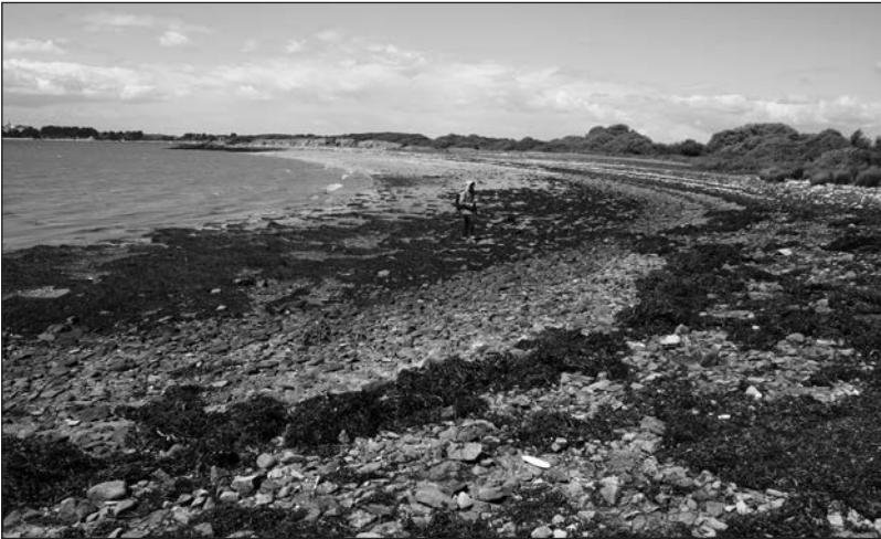
Figure 4 : Emplacement du site de la Grand Plage d'Ilur, sur la commune de l'Île d'Arz en 2011.

Le site positionné aujourd'hui sur l'estran a donc largement souffert de l'érosion (houle et vents d'ouest) ainsi que des marées, au fil des siècles (Fig. 4). Sa localisation, exposée aux aléas, a conduit à la fouille du site, avant la disparition de tous les vestiges.