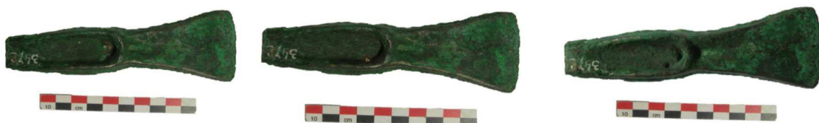
Aspect d'une hache avant, (à gauche), pendant et après (à droite) prélèvement

Les objets des dépôts sont prélevés au moyen d'une micro-perceuse permettant un impact limité. La surface est dégagée de sa corrosion et un prélèvement de 40mg de métal sain est effectué (l'altération de surface modifie la composition). Le trou n'est pas rebouché, ce dernier faisant ensuite partie de la vie de l'objet. Un peu de peinture acrylique peut être déposé sur le métal sain afin de limiter le contraste de couleur avec la surface corrodée (Fig.2). Les échantillons obtenus sous forme de copeaux sont ensuite dissouts dans 20 ml de solution acide obtenue par un mélange d'eau déminéralisée, d'acide nitrique et d'acide chlorhydrique, selon le protocole défini par Mille et Bougarit (Mille & Bougarit, 2000).