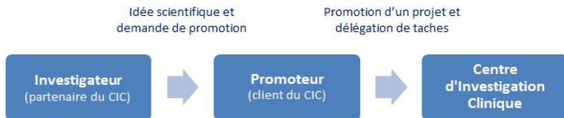
Figure 2. Traduction pour le centre d'investigation clinique (CIC) de la notion de « client » selon ISO 9001