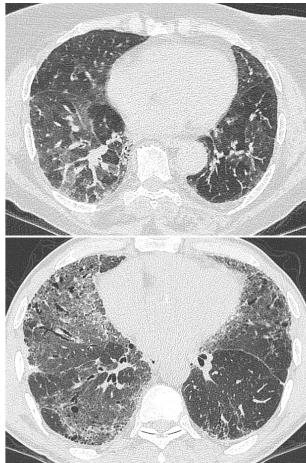
Figure 4. Exemples d'aspects tomodensitométriques non compatibles avec une pneumopathie interstitielle commune. Haut : hyperdensité en verre dépoli réalisant un aspect en mosaïque et micronodules centrolobulaires au cours d'une pneumopathie d'hypersensibilité aviaire ; bas : hyperdensité en verre dépoli, réticulation intralobulaire de répartition diffuse et bronchectasies par traction, au cours d'une pneumopathie interstitielle non spécifique idiopathique.

Ces affections sont évoquées sur les données de l'interrogatoire, de l'examen clinique, et de l'imagerie,