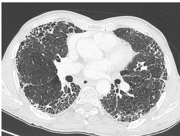
Figure 2. Aspect tomodynamétrique de pneumopathie interstitielle commune, comportant des opacités réticulaires de prédominance basale et sous-pleurale, un aspect en rayon de miel, des bronchectasies par traction, en l'absence de signe incompatible avec ce diagnostic (homme, fumeur, 68 ans).

porter le diagnostic de FPI selon les recommandations internationales [3].