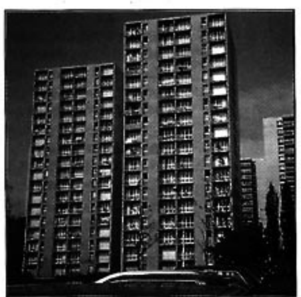
Immeubles ayant fait l'objet de l'étude, situés à Rennes.

Depuis novembre 1991, date de son installation, elle explique qu'elle a lutté pour s'installer véritablement dans cet habitat. En effet, ses amis n'ont pas tous réagi favorablement à la vue du quartier : « Les gens n'étaient pas habitués à nous voir évoluer dans un cadre comme ici, c'est là qu'on fait le tri de ses amis. » « C'est pareil pour l'immeuble. Les gens quand ils rentrent ici, me disent : tu as vu où tu habites, tu as vu comment ça sent, tu as vu de quelle couleur les gens sont. Moi c'était clair, je leur ai dit : il y a des cafards, si ça vous gêne, vous partez, si ça ne vous gêne pas, vous restez. » Mais elle a du lutter également contre l'intolérance et l'indifférence des gens du voisinage : « C'est vrai qu'au départ j'avais pris un peu l'habitude de dire : finalement, il ne faut pas regarder ce qu'il y a autour, il faut rentrer chez soi, s'enfermer. C'est chez toi que ça compte, c'est pas à l'extérieur et puis non, en fait il y a des gens très valables ici. C'est vrai qu'il faut faire le tri mais ce qui choque le plus, c'est l'intolérance : c'est toujours la faute à l'autre, ils ne